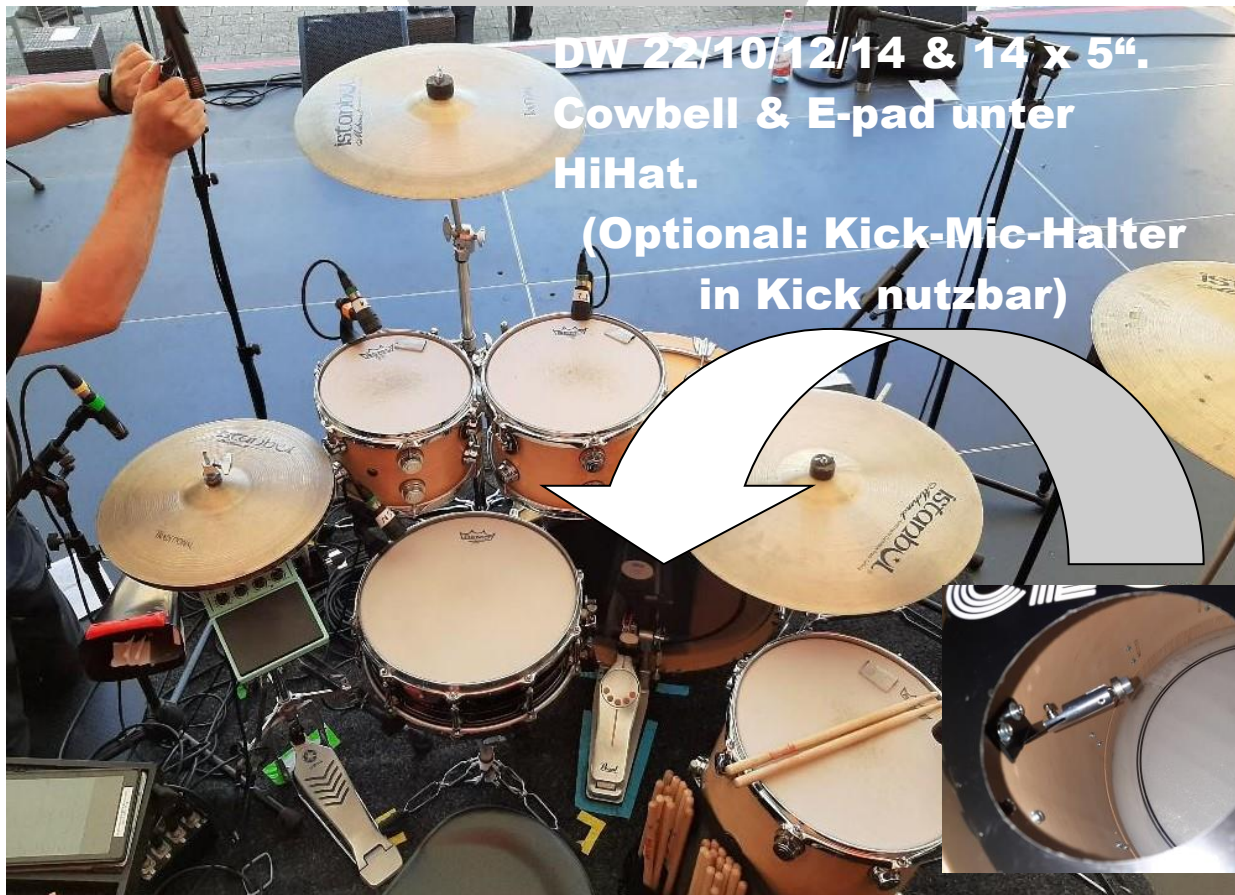
DW 22/10/12/14 & 14 x 5". Cowbell & E-pad unter HiHat. (Optional: Kick-Mic-Halter in Kick nutzbar)