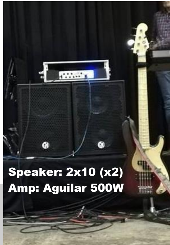
Speaker: 2x10 (x2) Amp: Aguilar 500W